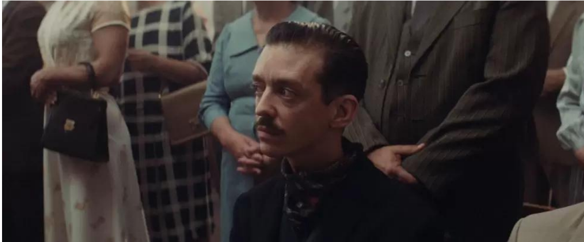
Escena de Narciso . Fotograma