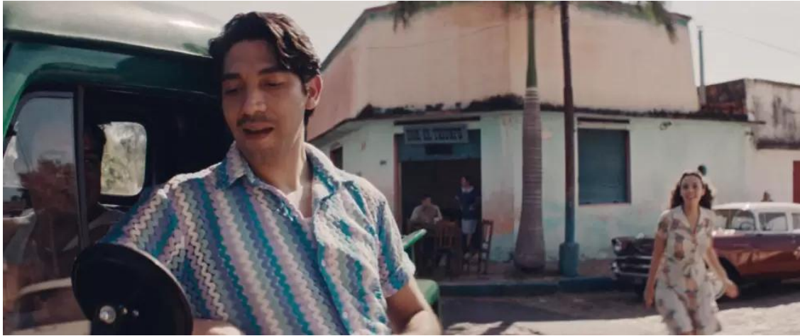
Escena de Narciso . Fotograma

despertar y Chinita Montiel volverá a cantar el folclor paraguayo en la escena final de la película.