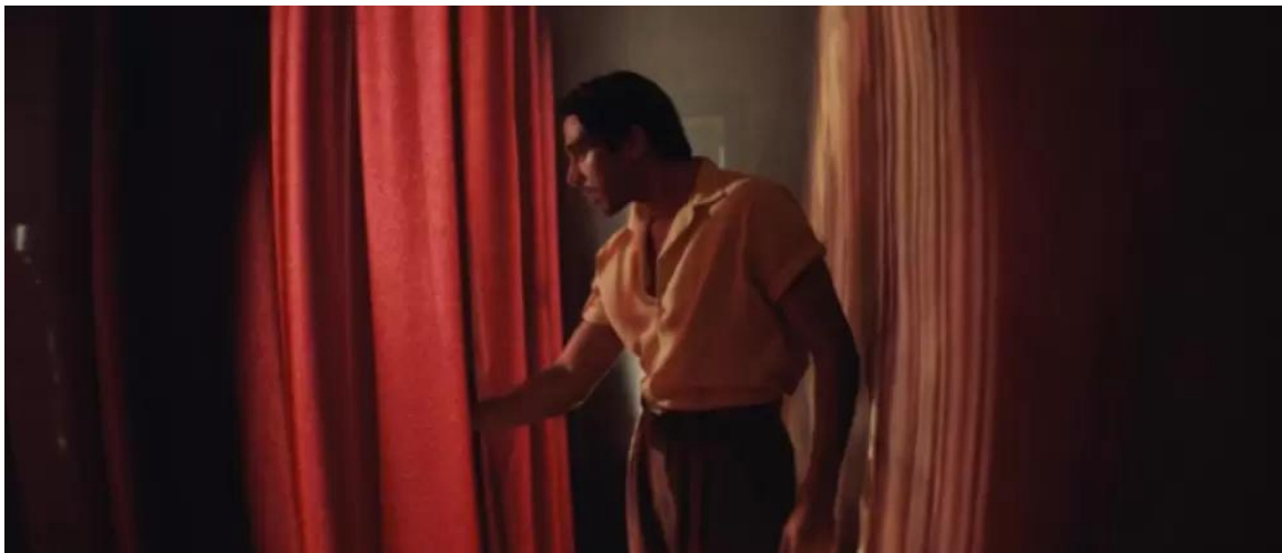
Escena de Narciso . Fotograma

De manera que, mientras que la novela comprueba una crítica minuciosamente investigada al creciente autoritarismo bajo Stroessner a finales de los años 50, la película presenta una historia de autoritarismo universal, donde reina el miedo, la vigilancia y el silencio. En los dos, el final claramente muestra que, en un régimen de opresión y terror, pierde el individuo y la libertad es una quimera.